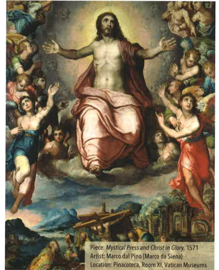
Piece: Mystical Press and Christ in Glory , 1571 Artist: Marco dal Pino (Marco da Siena) Location: Pinacoteca, Room XI, Vatican Museums

How can I yoke myself to Jesus, my Lord and king? What burdens, stressors, or disappointments can I hand over to God this week?