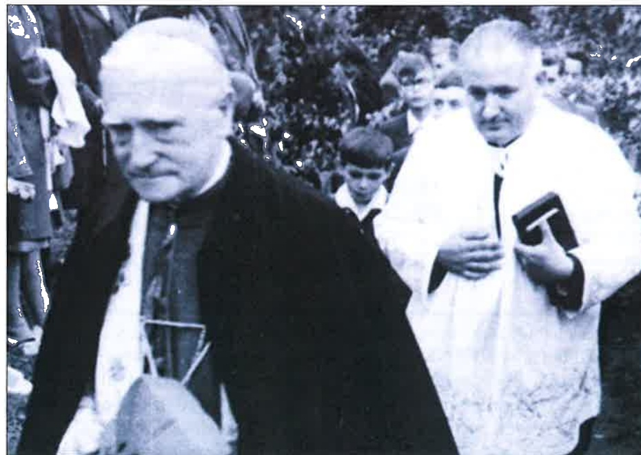
33 évvel ezelőtt, 1980 szeptember 29-én hunyt Márton Áron gyulafehérvári érsek.

Október hónapban a Szentolvasó imádkozásával Isten Anyját tiszteljük és megváltásunk titkaira emlékezünk. A Szentolvasó (= rózsafüzér) egy-egy szakaszát „tizednek” nevezzük. Minden tized egy Miatyánkkal kezdődik, majd tíz Üdvözlégy következik, amelybe a „titkot” befűzzük, végül egy Dicsőség zárja.