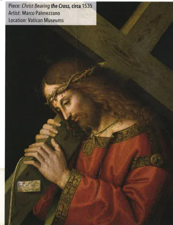
Piece: Christ Bearing the Cross , circa 1535 Artist: Marco Palmezzano Location: Vatican Museums