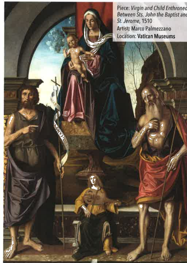
Piece: Virgin and Child Enthroned Between Sts. John the Baptist and St. Jerome , 1510 Artist: Marco Palmezzano Location: Vatican Museums